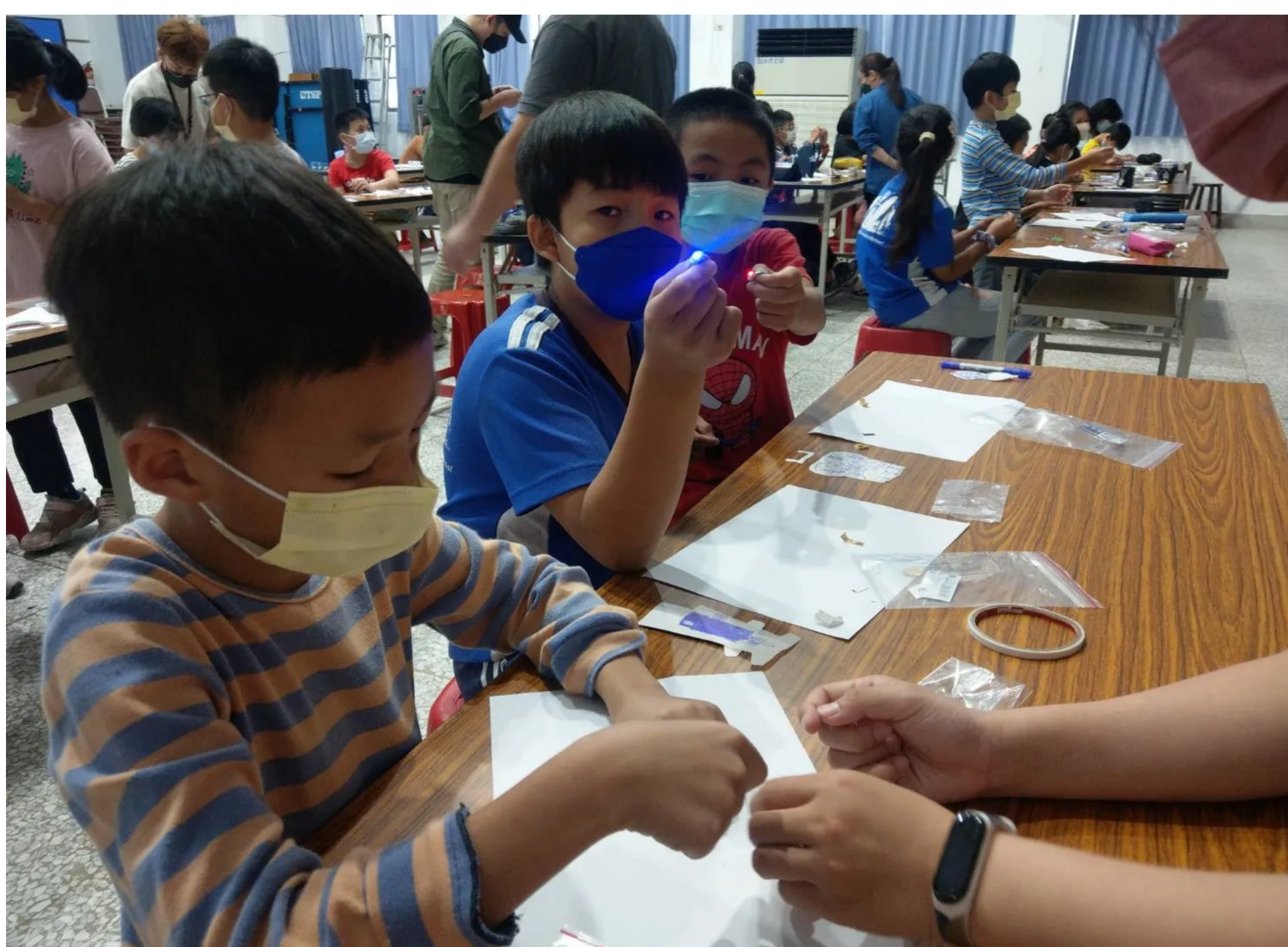
讓學生動手做平安燈

國立故宮博物院辦理「故宮創客魔幻列車」於10/27日來到花蓮縣壽豐鄉豐山國小，以活潑的方式介紹故宮珍藏文物，帶領學生走進科技的想像世界，並讓學生動手做平安燈，每個學生都以自己的方式彩繪出獨特的清花花燈，希望帶給大家平安、光明、希望。