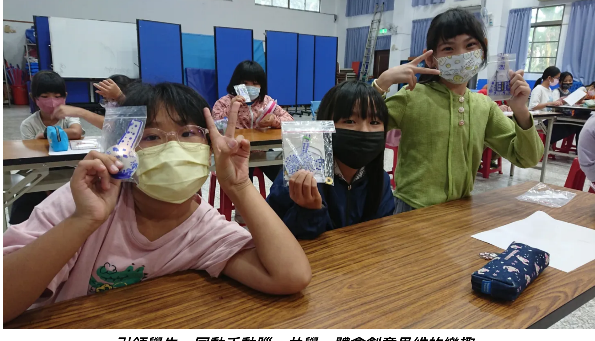
引領學生一同動手動腦、共學、體會創意思維的樂趣。

「故宮創客魔幻列車」為國立故宮博物院於2018年的啟航計畫，從臺北出發前往各縣市偏鄉城鎮，讓鮮少有機會接觸故宮文物的學子們，透過國寶STEAM（科學Science、科技Technology、工程Engineering、藝術Art及數學Mathematics）的教育活動，深入淺出體驗美學教育，認識文物藝術的創新與魅力。