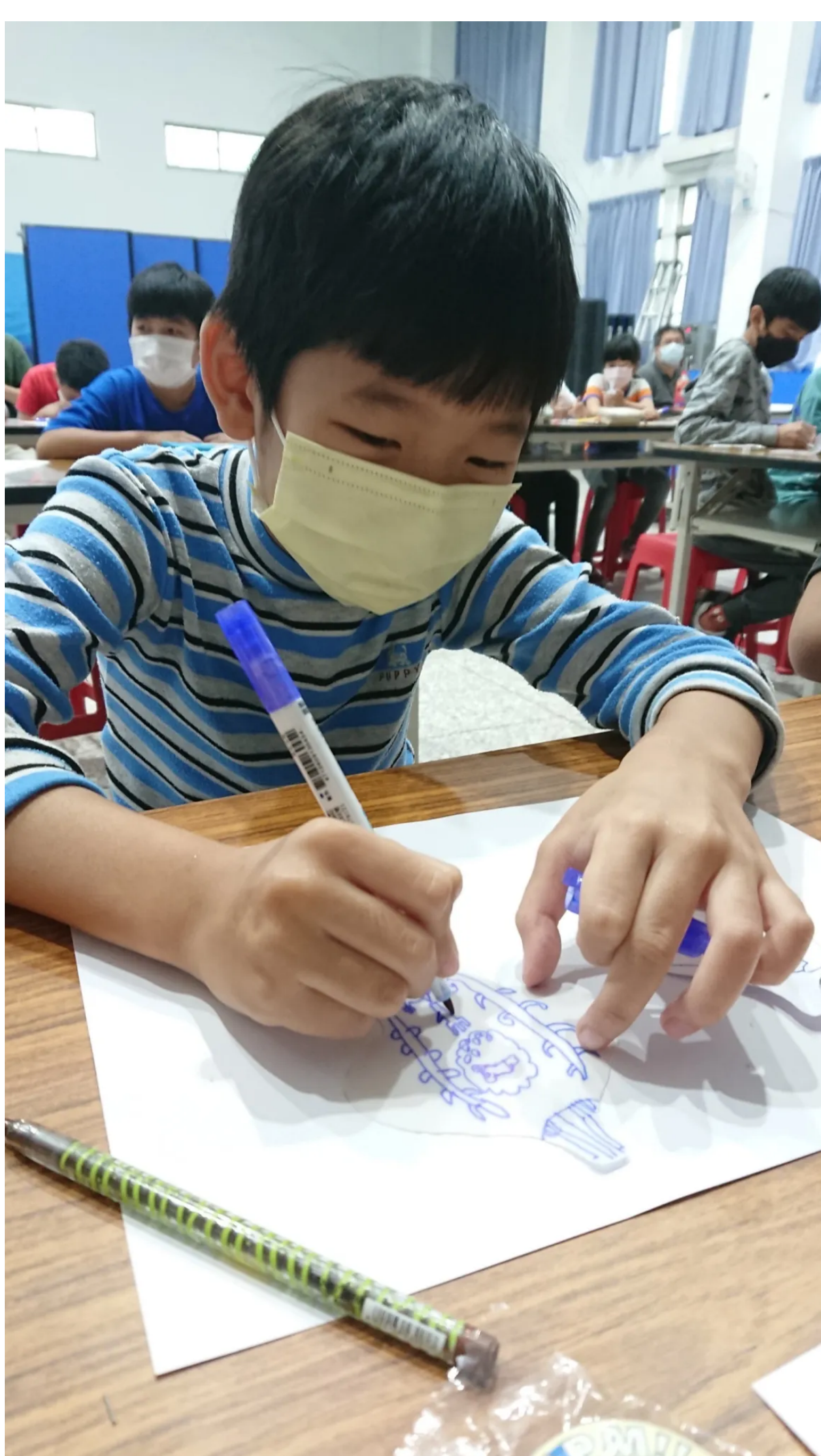
畫出自己喜歡的燈具形狀